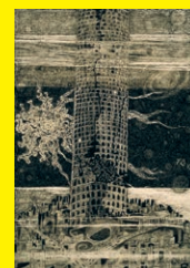
Friedrich Dürrenmatt, Turmbau IV: Vor dem Sturz, undatiert, Tusche (Feder) auf Papier, 51 x 36 cm, Privatsammlung

«Dürrenmatt als Zeichner und Maler. Ein Bildwerk zwischen Mythos und Wissenschaft» in Zusammenarbeit mit dem Centre Dürrenmatt Neuchâtel, 4. Juli bis 25. Oktober 2020.