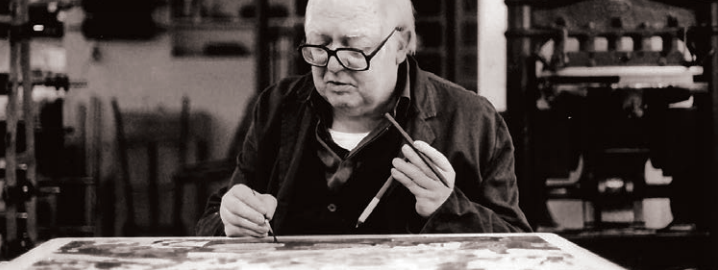
Friedrich Dürrenmatt beim Lithografieren, 1988