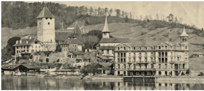
Der Schlossbesitzer Ferdinand Rudolf Albrecht von Erlach investierte in den Tourismus: er liess den See aufschütten und durch den Architekten Horace Edouard Davinet das Hotel Spiezerhof bauen. Foto: Hotel Spiezerhof im Bau, 1873