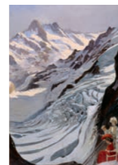
Umschlag: Station Eismeer der Jungfrau-Bahn mit Schreckhörnern. Der Plakatmaler Anton Reckziegel setzt sich selbst als Tourist ins Bild. Original in der Ausstellung. Anton Reckziegel (1865–1936), Entwurf Schreckhörner (Ausschnitt), nicht publiziert, 1905, Gouache, 94,5 × 66,5 cm, Alpines Museum der Schweiz

19.00 Nachtessen im ABZ für angemeldete Gäste